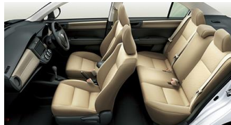
カローラアクシオ (定員5)